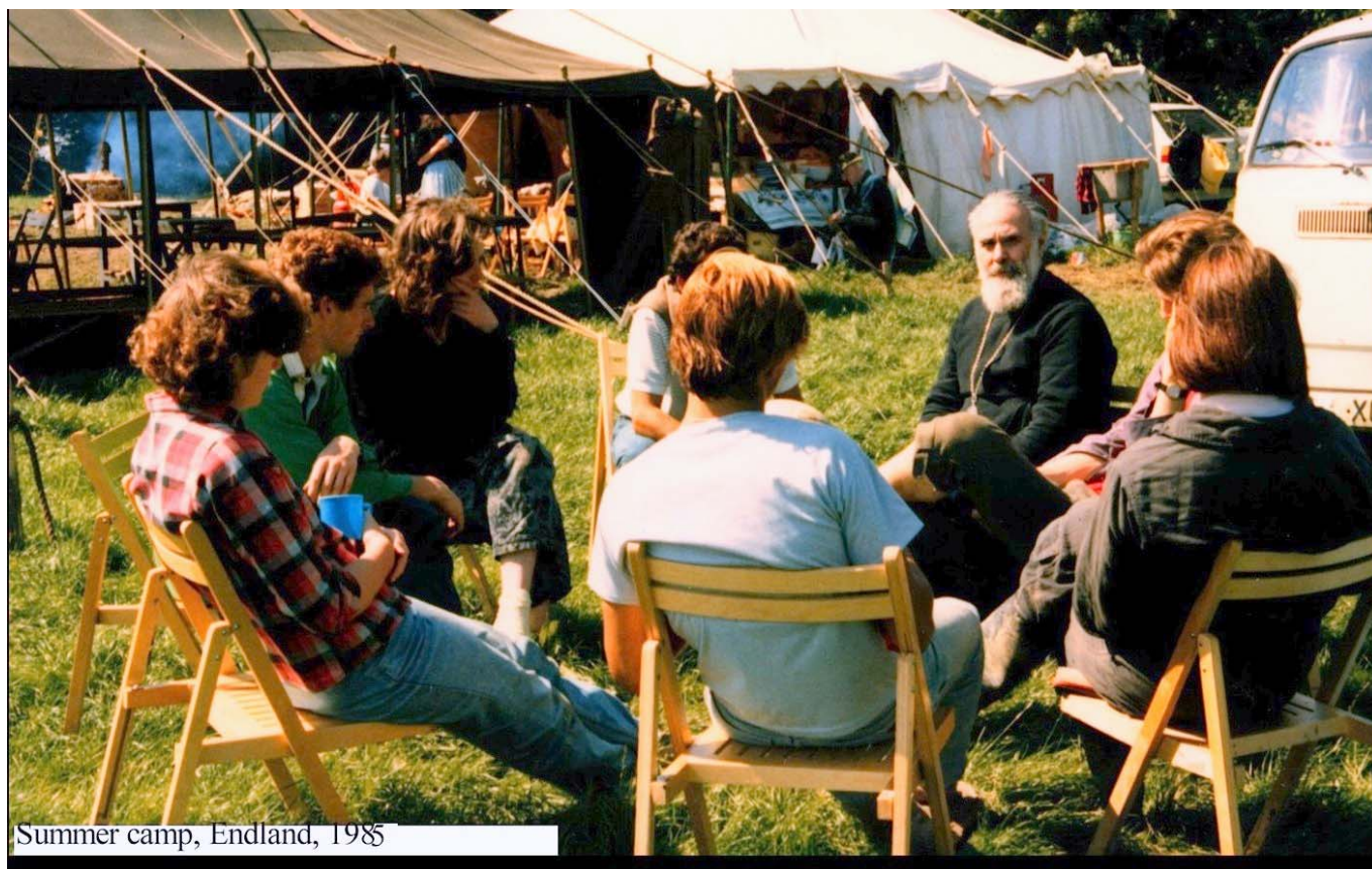
Summer camp, Endland, 1985

Это Движение не замкнуто, оно открыто. Об этом свидетельствует, например, тот факт, что молодые люди и девушки ездят и знакомятся с православной заграницей /лагерь РСХД во Франции, в Греции - съезд Синдезмаса - это всемирная Федерация православных молодежных движений/, а также создание пока еще скромного молодежного журнала, который они самостоятельно редактируют и который предполагается рассылать по всей стране. В конце года должен состояться второй Епархиальный Съезд молодежи /первый такой съезд состоялся в Бристоле прошлым декабрем и собрал свыше 40 молодых людей и девушек от 14 лет и выше/; организаторам предстоит организовать Съезд как можно удобнее, симпатичнее, веселее; но одно из важных требований, которые будут перед ними стоять и о чем неоднократно уже говорилось в Бристоле и после Бристоля, это задача молодежи приобретать те насущные знания о православной вере, которые будут способствовать им со временем стать проповедниками и защитниками веры в мире, в котором они живут.