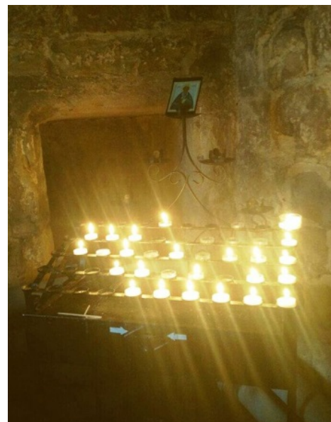
Икона св. Айдана Линдисфарнского

- Конечно же, запомнился Линдисфарн, который можно назвать «английским Афоном». Ведь уже в седьмом веке там подвизались св. Айдан и св. Кутберт. Мы посетили место, где одному из святых довелось видеть, как за душой св. Айдана сошли два ангела, и его душа вознеслась к небу. Недалеко от Линдисфарна расположен небольшой остров. Из-за постоянных приливов и отливов до острова можно добраться посуху до того, как происходит прилив. На острове установлен крест, и когда вода отходила, туда пешком отправлялись молиться св. Айдан и св. Кутберт. Из-за нашествия викингов монахи часто там погибали. Оттуда совершенно не хотелось уезжать, чувство благодати не покидало нас.